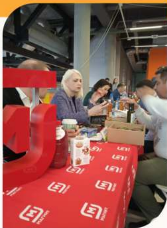
Работа Торгово-закупочной конференции