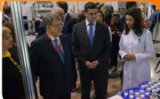
Осмотр официальной делегацией