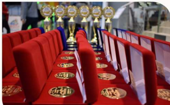
Награждение победителей конкурса